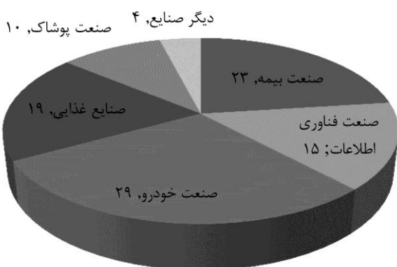
شکل ۲- تفکیک صنایع سازمان‌های نمونه

نفر پرسنل، ۲۰ سازمان بین ۱۰۰ تا ۵۰۰ پرسنل و ۸ سازمان کمتر از ۱۰۰ نفر پرسنل برخوردار بودند. توزیع سازمان‌های نمونه به تفکیک صنایع در شکل ۲ نشان داده شده است. صد پرسشنامه برای مدیران عالی و مدیران فناوری اطلاعات این سازمان‌ها ارسال گردید. در مدت چهل و پنج روز ۸۳ پرسشنامه جمع آوری شد.